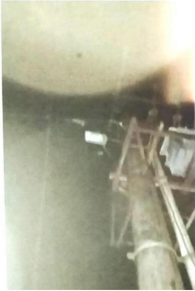
1. Lampu Mati